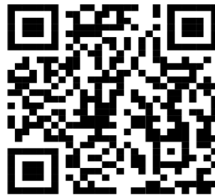
ลงทะเบียนสมัครอบรม