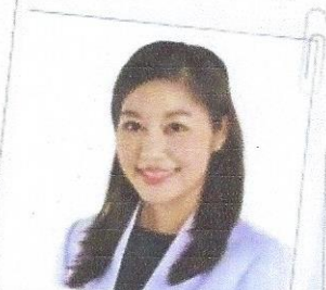
หมอน้ำหวาน